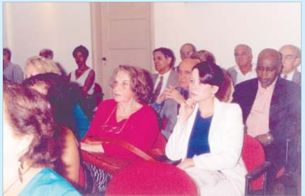
Flagrante da assistência que prestigiou a tradicional cerimônia de outorga de comendas de mérito da APAFERJ