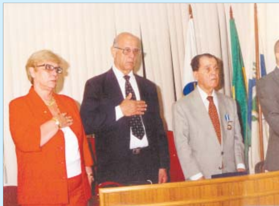
Os integrantes da mesa que dirigiu os trabalhos ouvem a execução do Hino