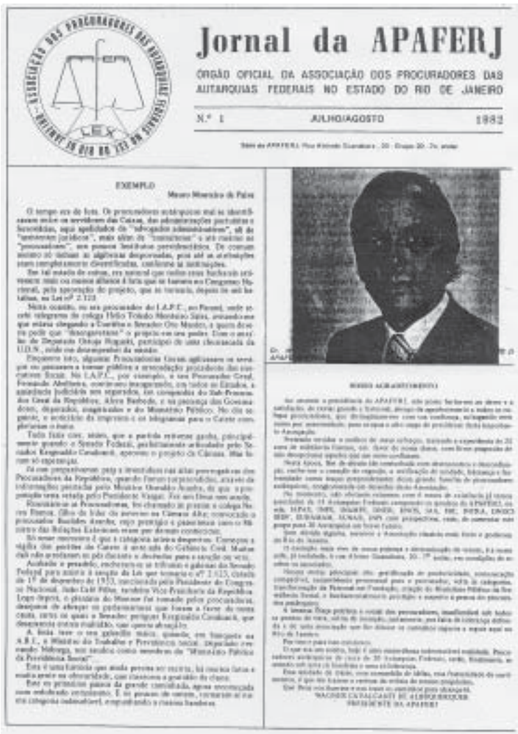
Primeira edição do Jornal da APAFERJ

Na próxima edição daremos continuidade à história da APAFERJ, com datas e fatos marcantes.